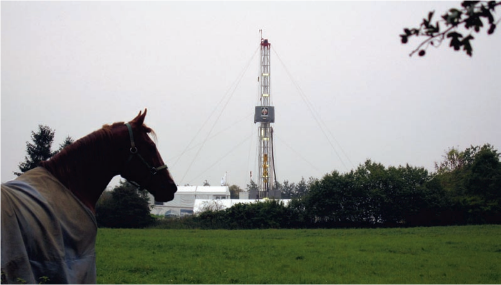
Oljeprospektering bland danska hästagar och fruktodlingar kräver stora åtaganden för att bli godkänd ur miljöhänsyn.

Vid sidan av Jebel Aswad och Wadi Saylah har ett dussintal ytterligare potentiella olje- och gasförande strukturer upptäckts. För att bättre förstå och kartera dessa kommer en del av drygt 2 500 kilometer befintlig 2D seismik över Block 15 att omtolkas och delvis ombearbetas.