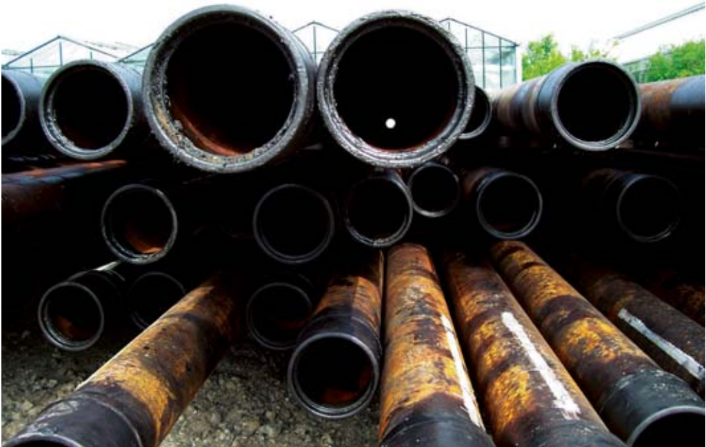
Lager med foderrör

pacitet. Arbetsprogrammet kommer att omfatta återinträde och uppborrning av de två tidigare genomförda borrhningarna och med utgångspunkt i dessa kommer sedan horisontella sektioner att borraras med underbalanserade borrhvåtskor i de sektioner som från utförda loggar förefaller mest produktiva. Genom att borra "underbalanserat" undviks skador på reservoaren som kan uppstå vid borrhning, då borrhvåtskan inte pressas in i reservoaren utan denna förblir opåverkad och öppen gentemot hålet. Dessutom kommer mer detaljerade undersökningar av prospektiviteten i den södra delen av Block 15 att genomföras, där flera möjliga geologiska strukturer identifierats.