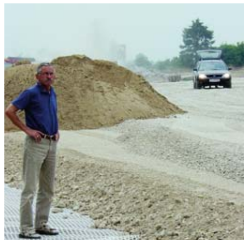
Grundarbeten på borrhplatsen. 1) Schaktning 2) Matta för att förhindra att gruset och leran blandas 3) Ca. 1/2 m grövre grus 4) Ca 25 cm finare grus (slutligen tillkommer 10 cm asfalt)

Under andra kvartalet har tolkning av den geokemiska markstudien på licens 1/03 också slutförts. Resultatet är uppmuntrande, men slutgiltig utvärdering av licensens möjligheter kommer dock att ske efter att resultatet av prospekteringsborrningen på 1/02 föreligger.