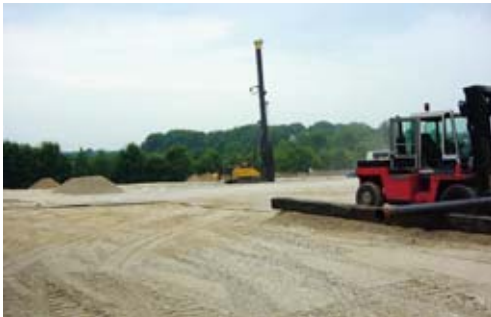
Borr-riggens kommande placering sedd från foderrörsupplaget.

I juli 2006 skrev Tethys Oil ett Letter of Intent med Star Energy Group plc (Star Energy) rörande utfarmning av Tethys andel i de danska licenserna. Enligt avtalet blir Star Energy partner med Tethys med en andel om 20 procent i licens 1/02 och 1/03. Tethys andel minskar från 70 till 50 procent. Enligt överenskommelsen skall också Star Energy ersätta Tethys med 20 procent av hittills nedlagda investeringar i licenserna, samt betala 40 procent av kostnaden för prospekteringsborrningen på licens 1/02. Det monetära värdet av avtalet uppskattas till omkring MSEK 13 (MUSD 1,8 eller MGBP 1).