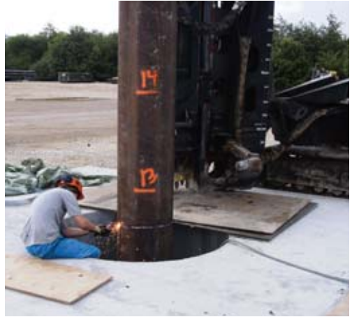
Kapning av ledrör. Det första av många foderrör som kommer att sänkas i Karlebo.

Licensvillkoren, som ursprungligen gav Tethys rätt att genomföra undersökningar i licensområdet t o m 28 juli 2006, har förlängts med tre månader. Under denna förlängning kommer Tethys att utarbeta det optimala framtida arbetsprogrammet, som sedan blir underlag för nya förhandlingar med det statliga marockanska bolaget ONYHM (Office National des Hydro-carbures et des Mines) i syfte att konvertera licensen till en fullständig prospekteringslicens.