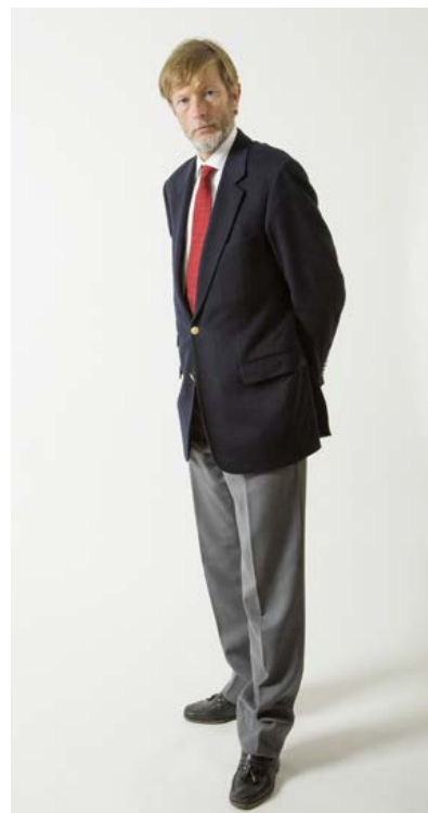
Stockholm i maj 2014

Siffrorna understryker att vi är i en bättre ställning än någonsin tidigare. Vårt finansiella resultat är på rekordnivå. Vår produktion är på rekordnivå. Borraktiviteten är på rekordnivå. Och antalet aktieägare är på rekordnivå. Så välkomna ombord och fortsatt följa oss.