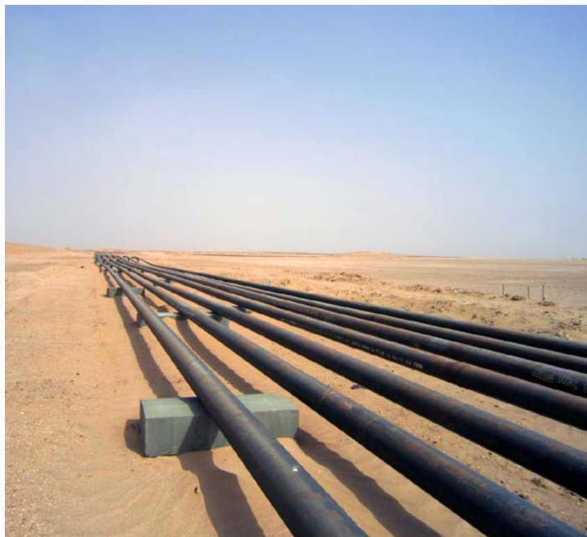
Farha Early Production Facilities

Vi har idag meddelat ytterligare en framgångsrik borrhning på ett tidigare oborrat förkastningsblock på Farha Southområdet – borrhningen Farha South-12 på Block 3. Genom sommarens framgångsrika borrhningar har Farha South-trenden med oljeförande förkastningsblock väsentligt utökats och utvecklat området till ett utvärderings-/prospekteringsprojekt av större omfattning än tidigare bedömt. Hela Farhatrenden med förkastningsblock tycks vara oljeförande både i Barik- och Lower Al Bashairformationerna, om än i olika omfattning. Resultaten hittills tyder på att varje borrhål på Farha