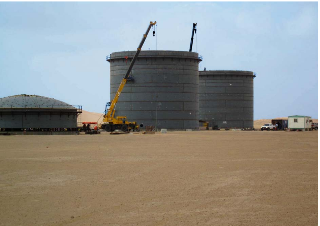
Saiwan site construction